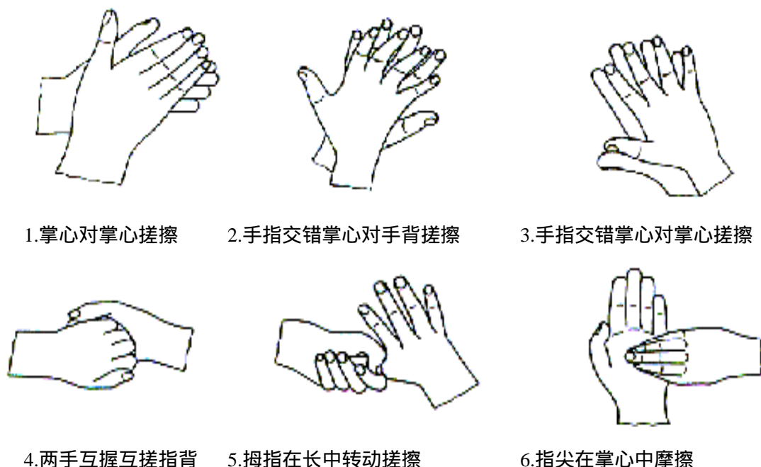
图 2-1 标准的洗手方法

(9) 参考样品组: 对于卫生手消毒, 取 60% 异丙醇 3 ml 到入手心中, 按标准的洗手方法用力搓擦 30s。以确保手的所有部位均匀接触异丙醇。重复使用异丙醇按上述方法搓擦使总的搓擦时间为 60s。对于外科手消毒, 使用 60% 正丙醇 3ml, 按标准的洗手方法用力搓擦, 当接近干燥时, 再加 3ml 正丙醇搓擦。以保持作用 3min。用流动的自来水冲洗 5s, 抖掉手上残留的水。其余步骤与试验样品组相同。